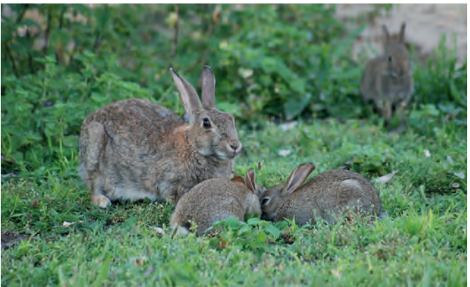
Mehrere Wildkaninchen-Generationen leben auf kleinen Arealen zusammen.

Die ursprüngliche Heimat der Wildkaninchen ist die Pyrenäenhalbinsel und Nordafrika, wo die Art in fast unverändertem Zustand die letzte Eiszeit überdauerte. Durch die Phönizier wurde der Name Sphania, was so viel wie Kaninchen bedeutet, für Spanien geprägt. Von dort aus wurden die Tiere durch den Einfluss des Menschen nach West- und Mitteleuropa gebracht. Bereits im 1. Jahrhundert vor unserer Zeitrechnung wurden Kaninchen durch die Römer für kulinarische Genüsse aus Iberien importiert. Auch hielt man sich Kaninchen in Klöstern und an Höfen geistlicher Würdenträger, da das Fleisch neugeborener Tiere als Fastenspeise erlaubt war.