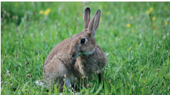
Wildkaninchen bei einem „Sonnenbad“.