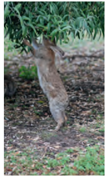
Wildkaninchen können durch das „Aufstellen“ auch an höher gelegene Nahrungsquellen gelangen.

Bei der Nahrungssuche sind Kaninchen nicht wählerisch. Neben Gräsern, Kräutern, Trieben, Knospen werden auch Rinde, Getreide, Gemüse oder Rüben gefressen. Sie schrecken selbst vor Disteln oder Brennnesseln nicht zurück. Treten die possierlichen Nager in großer Dichte auf, werden fast alle Stauden und Gehölze gärtnerischer Kulturen geschädigt. Besonders in harten und schneereichen Wintern nagen die Tiere gern die Rinde junger Bäume und Sträucher ab und können fingerstarke Bäume ganz abbeißen. Um ihren Vitamin B1 – Bedarf zu decken, wird zusätzlich im Winter ein im Blinddarm produzierter bakterien- und vitaminreicher Kot nach dem Ausscheiden sofort wieder aufgenommen. Bei gefangen gehaltenen Tieren wurde beobachtet, dass sie auch tierische Nahrung, wie Hackfleisch und Fleischreste an Knochen fressen.