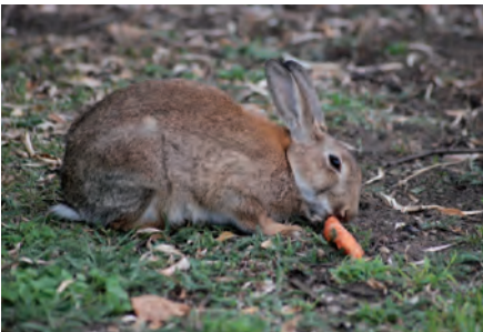
Möhren, Salatblätter und andere Kompostreste sind beliebte Nahrung für die Wildkaninchen.