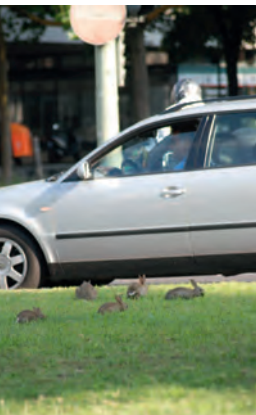
Wildkaninchen leben mitten in der Großstadt – wie hier auf dem Mittelstreifen.

Tierseuchenbekämpfung dem jeweiligen Grundstückseigentümer eine beschränkte Jagdausübung durch ausgewählte Jäger genehmige Voraussetzung ist immer eine gefahrlose Schussabgabe.