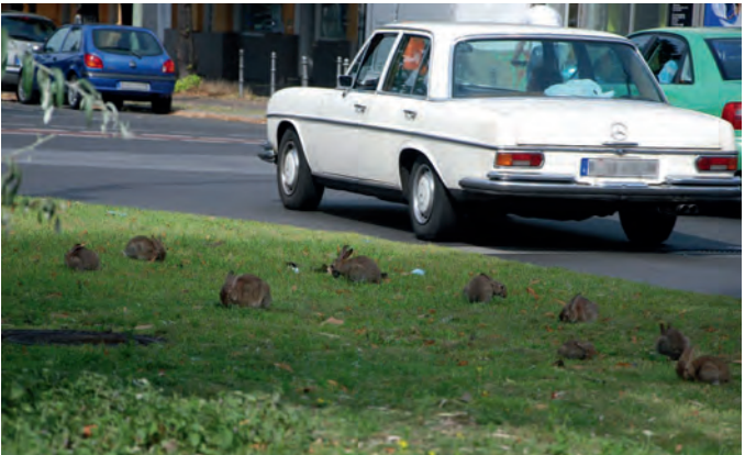
Wildkaninchen leben auch unmittelbar an Straßen.

Art des Virusstammes, nach 14 Tagen bis 50 Tagen einen qualvollen Tod. Tiere, die an Myxomatose erkranken, verlieren offensichtlich die Orientierung. Ein so erkranktes Kaninchen verkriecht sich nicht mehr in seinen Bau, sondern bleibt regungslos sitzen, auch wenn man sich dem Tier nähert. Aus Sicht des Tierschutzes und der Seuchenbekämpfung ist es angezeigt, ein solches Kaninchen dem zuständigen Veterinäramt zu melden, damit es von seinem Leiden erlöst und eingeschläfert werden kann.